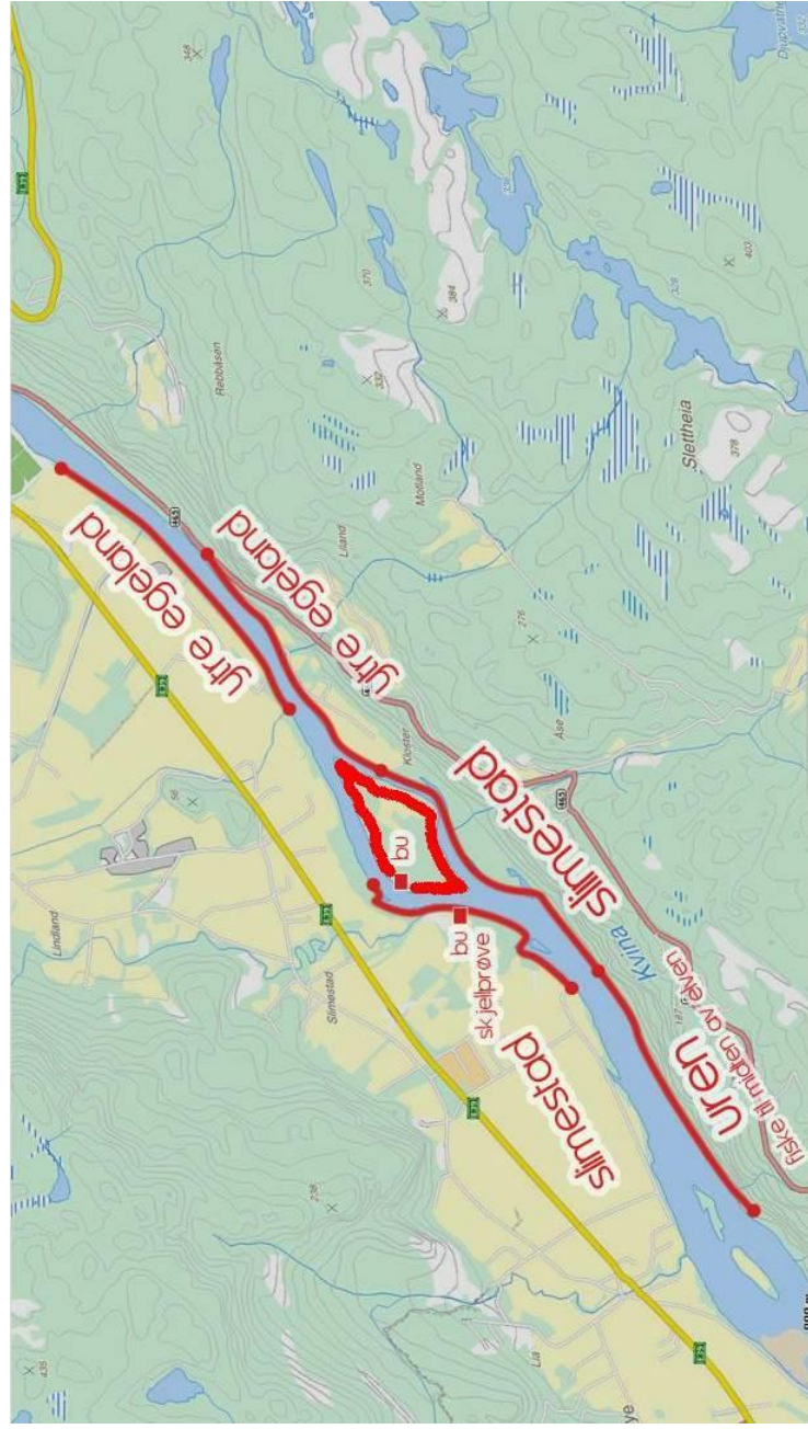
Uren - Slimestad - Ytre egeland